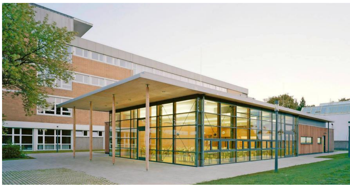
Neubau am Wilhelms-Gymnasium: Der Mensa-Vorbereich ist ein markantes Gebäudeelement.

Die Stadt Stuttgart ließ das Gebäude für 2,36 Millionen Euro von Gergs-Blum-Schempp Architekten aus Stuttgart zwischen November 2014