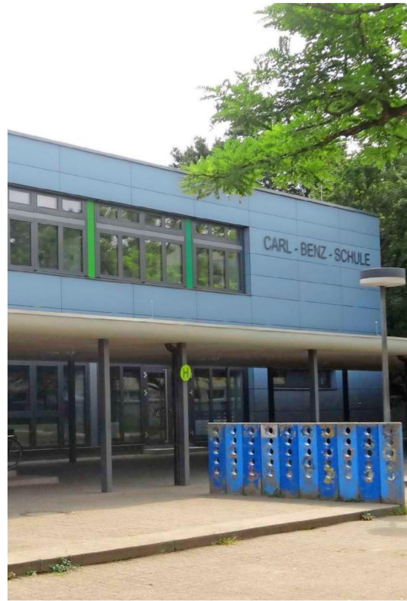
Ziel der Sanierung der Carl-Benz-Schule war es, die Gebäudehülle funktional, energetisch und gestalterisch zu erneuern.

Der Hintergrund der Sanierung war das Alter und damit der nicht mehr zeitgemäße Zustand der zwischen 1969 und 1972 errichteten Schule. Am Hauptgebäude waren im Lauf der Jahre lediglich Instandsetzungsarbeiten durchgeführt worden, es musste deshalb umfassend saniert werden.